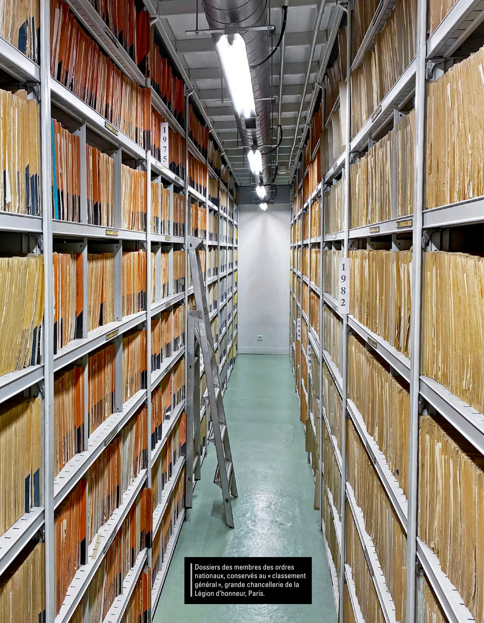
Dossiers des membres des ordres nationaux, conservés au « classement général », grande chancellerie de la Légion d'honneur, Paris.