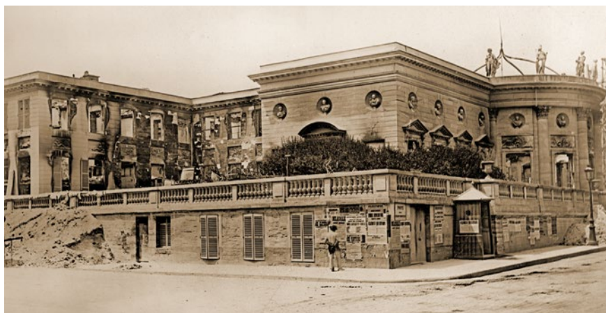
Vues du palais de la Légion d'honneur après l'incendie de 1871, coll. musée de la Légion d'honneur.