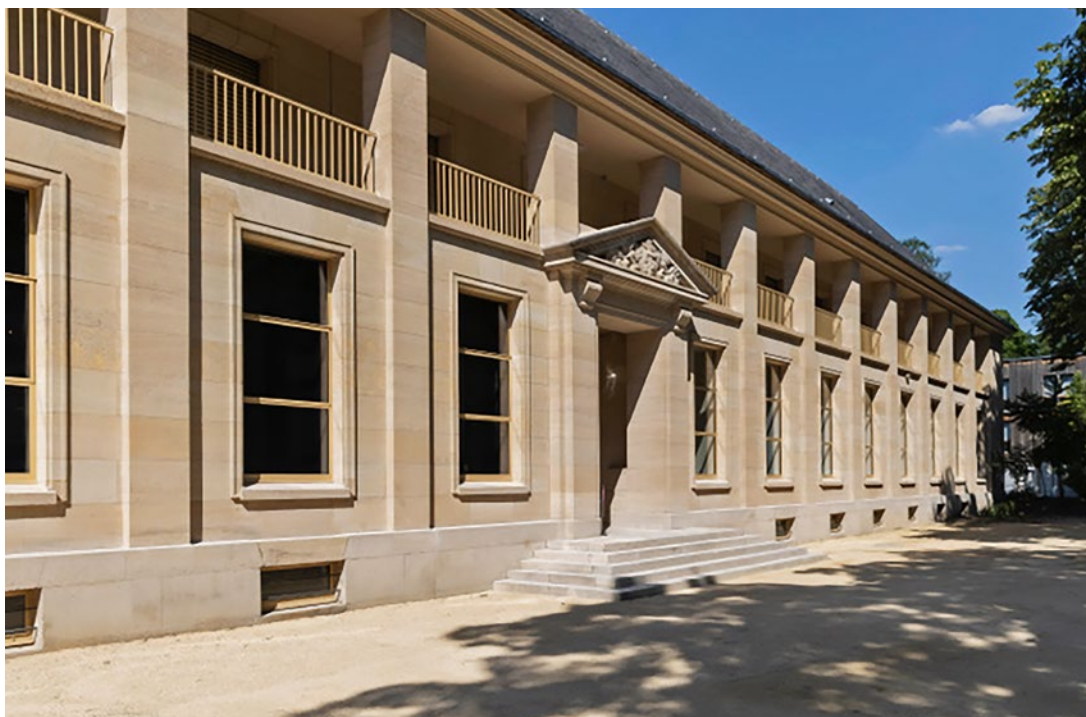
Façade après restauration de l'ancienne infirmerie de la maison d'éducation de Saint-Denis, nouveau « pavillon des archives » de la grande chancellerie de la Légion d'honneur.

Pour aboutir à une meilleure connaissance et mise à disposition du public de ces archives, le projet comporte deux volets majeurs. Le premier a pour objet d'inventorier, classer, trier et déménager les archives physiques de la grande chancellerie des origines à nos jours, aussi bien dans son fonctionnement administratif que pour la gestion des décorés de la Légion d'honneur, de la Médaille militaire, de l'ordre national du Mérite et de la Médaille nationale de reconnaissance aux victimes du terrorisme. Les dossiers de gestion et des élèves des maisons d'éducation de la Légion d'honneur font également partie intégrante du projet.