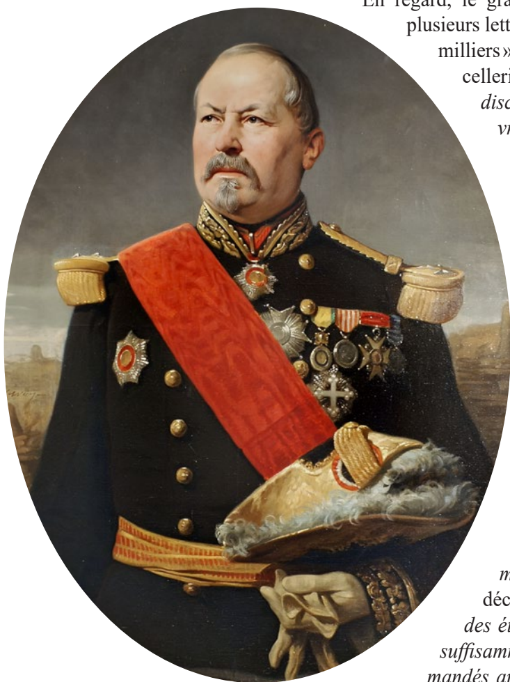
Portrait du général Vinoy (1800-1880), grand chancelier de 1871 à 1880, huile sur toile d'Adolphe Yvon (1817-1893), 1876, coll. grande chancellerie de la Légion d'honneur.

Organisateur bien conseillé, le général Vinoy précise le modus operandi de la collecte des pièces justifiant d'une décoration : « À ce point de vue complexe, j'ai fait établir des états individuels dont le simple examen vous indiquera suffisamment la destination. Envoyés par vos soins et recommandés aux maires de toutes les communes, ces états pourront être remplis, soit par les secrétaires des mairies, soit par les titulaires eux-mêmes, et, à défaut de ceux-là, par les instituteurs